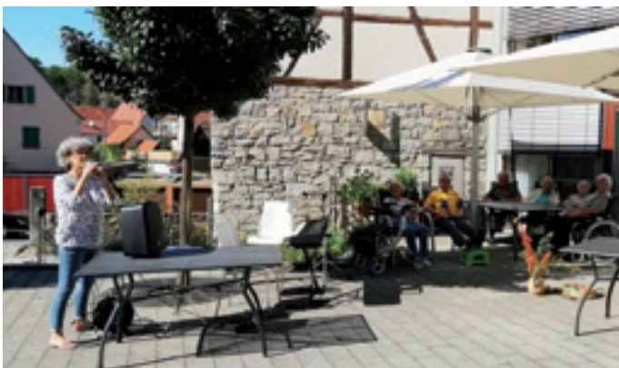
Eine große Freude bereitet Frau Kanderts Musikstunde unter dem Motto „Wir machen Musik“ den Bewohner*innen der Senioren-WG.